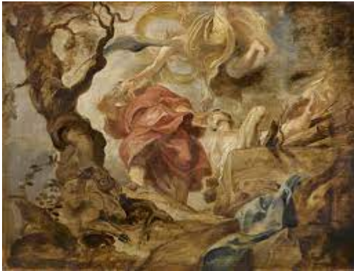
Η θυσία του Αβραάμ -Petrus Paulus Rubens