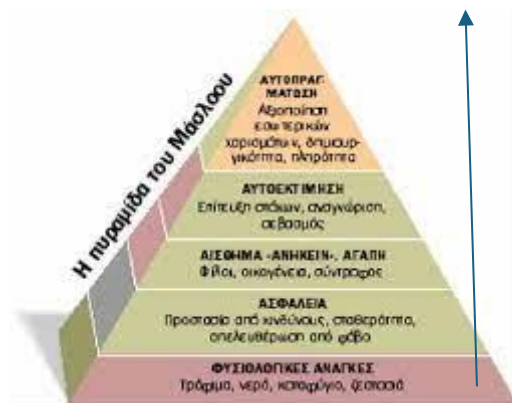
ΠΙΝΑΚΑΣ 1. ΑΡΧΙΚΗ ΠΥΡΑΜΙΔΑ ΑΝΑΓΚΩΝ ΤΟΥ MASLOW

(Τσαραμύρη, 2020 Abraham Maslow Η πυραμίδα των Αναγκών. Βασισμένη στα Maslow, 1943, 1954)