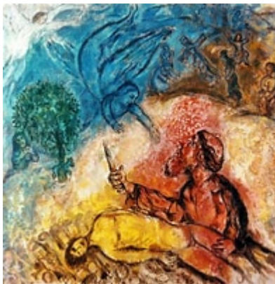
Η θυσία του Ισαάκ 1960-1966 Marc Chagall

Στην γλυπτική η παρουσίαση της Μήδειας από το γλύπτη Γιαννούλη Χαλεπά, συνδέεται άμεσα με την αντιμετώπιση που είχε από την μητέρα του. Μελετά το θέμα της Μήδειας για πρώτη φορά το 1976. Μετά το θάνατο της μητέρας του επανέρχεται στη θεματική με τρεις διαφορετικές εκδοχές όπου κυριαρχεί η γυναικεία μορφή κρατώντας μαχαίρι. Στην πιο βίαιη εκδοχή το η μια παιδική μορφή είναι προσκολλημένη στο σώμα της ενώ το άλλο παιδί προσπαθεί να απομακρυνθεί. Στις μεταγενέστερες εκδοχές τα σώματα των δύο παιδιών είναι μακριά από το σώμα της μητέρας τους και παρουσιάζονται περισσότερες λεπτομέρειες ως προς τα χαρακτηριστικά του προσώπου και του σώματος.