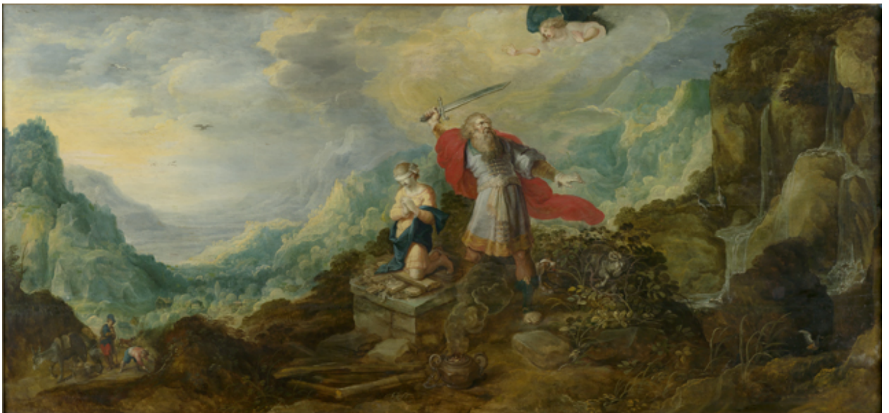
Τοπίο με τη θυσία του Αβραάμ Frans Francken

Η λέξη Αβραάμ σημαίνει πατέρας πολλών ανθρώπων, πολλών εθνών, και δείχνει ότι η θυσία δεν είναι απλώς ένα ζήτημα που περιορίζεται σε μια οικογένεια ή μια μικρή ομάδα, αλλά μάλλον ένα παγκόσμιο γεγονός. Σε αυτή την περίπτωση, η θυσία είναι μια πράξη υποταγής στο θέλημα του Θεού και το παιδί δεν γνωρίζει